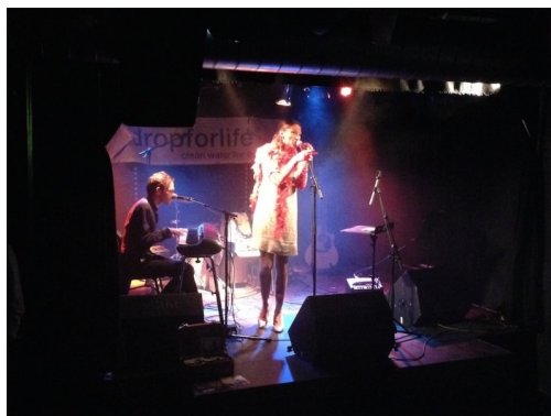
Sugar and the Josephines